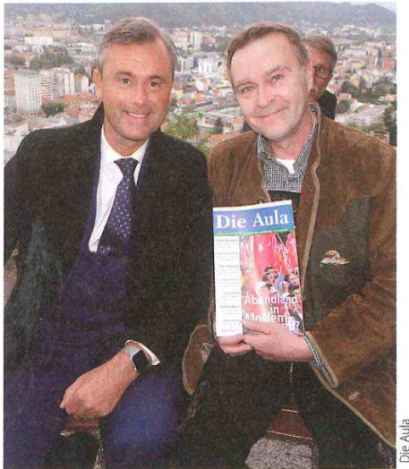
Die Aula bei Hofer: auf Du und Du

Hofer posiert im November 2016 für ein Werbefoto für das rechtsextreme und neonazinahe Magazin „Aula“. In der „Aula“ wird auch mehrfach in Inseraten des FPÖ-Bildungsinstituts ein Buch von Hofer beworben.